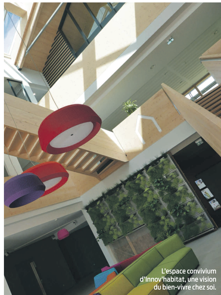
L'espace convivium d'Innov'habitat, une vision du bien-vivre chez soi.

Au rez-de-chaussée on l'a dit, il y a aussi le café Fauve et sa déco tout