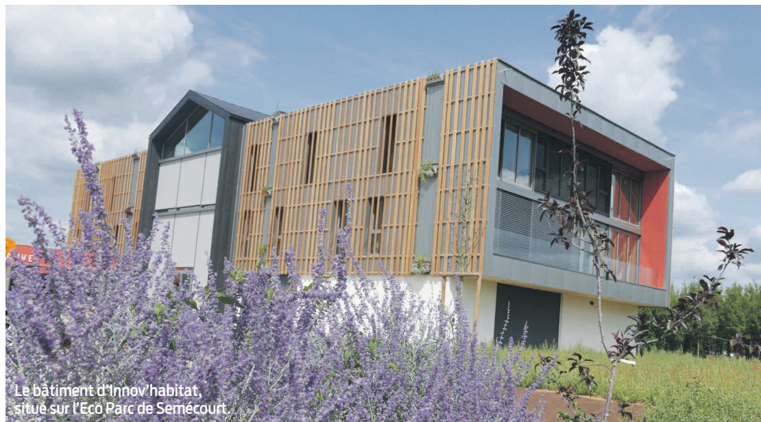
Le bâtiment d'Innov'habitat, situé sur l'Eco Parc de Semécourt.

Convivium c'est une arche signal qui retient le regard et qu'on repère assez vite sur ce secteur de l'Eco Parc où ont aussi poussé les jolis immeubles de bureaux Meltem et Marin. Convivium c'est une deuxième arche, entrée dans le bâtiment où vous attend un espace ouvert et lumineux. Façades vitrées